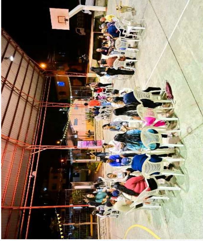
FRANCIS PAVÓN | Alcalde • Gualaquiza tiene futuro