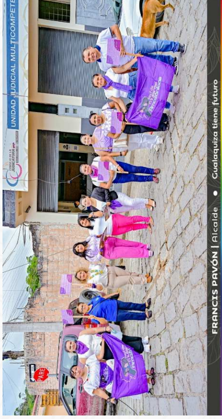
FRANCIS PAVÓN | Alcalde • Gualaquiza tiene futuro