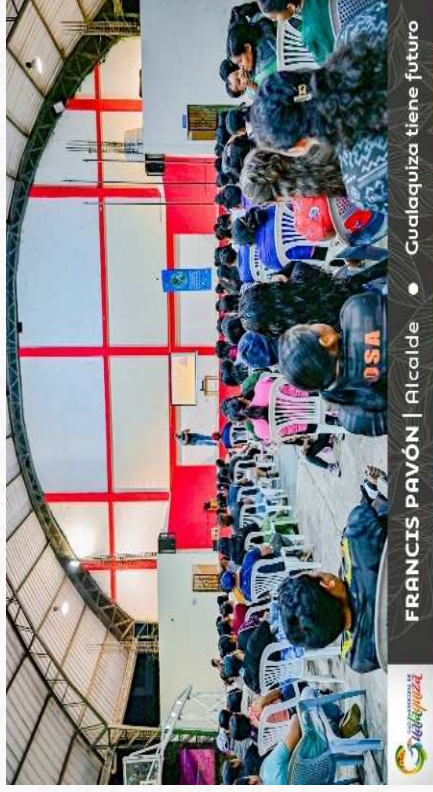
FRANCIS PAVÓN | Alcalde • Gualaquiza tiene futuro